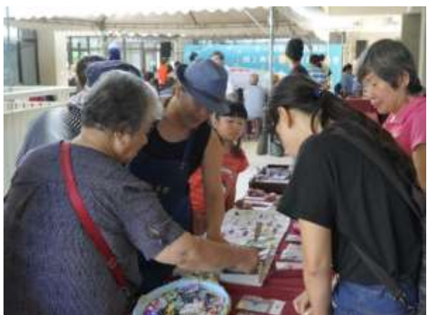
十一份竣工典禮暨園遊會成果照