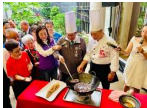
石門活魚記者會現場烹飪秀