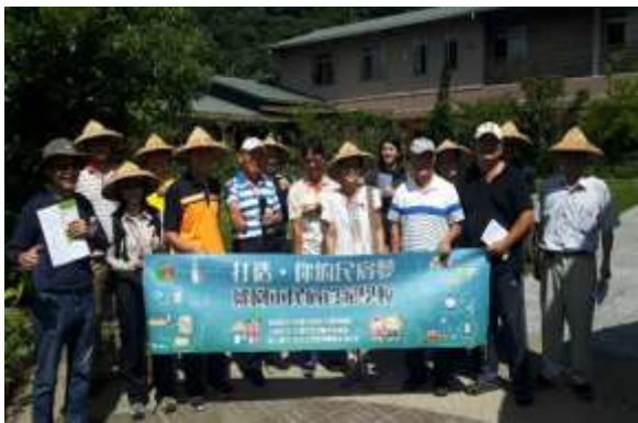
辦理體驗導覽工作坊

除了民宿量的提升，更重視民宿的服務，本府自 108 年開辦民宿管家學校，課程包括基礎課程、主題工作坊及個案輔導，學員來自休區、老城區、青年及一般民眾等，其中已經營民宿、暨有房屋欲加入民宿及其他有意經營、代管民宿、擔任民宿管家等共 75 案，並辦理 20 家個案輔導。