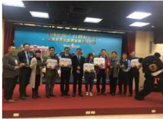
108年度「台灣好行」服務管理及服務品質頒獎典禮