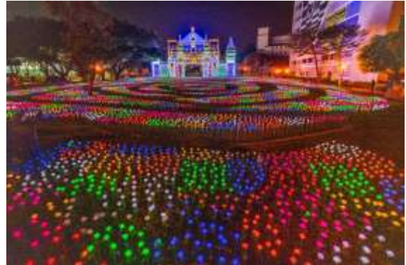
光明公園大地花毯秀及魔幻城堡