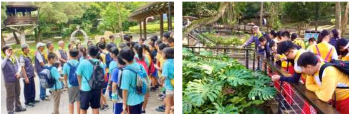
環境教育活動生態解說

經由虎頭山環境教育園區成功經驗，持續提升環境教育推廣品質與力度，目前已完成角板山園區、小烏來園區各 3 套環境教育課程方案編撰及 50 名環教種子講師培訓，並分別於 108 年 11 月及 12 月提送環保署申請環教設施場所認證。