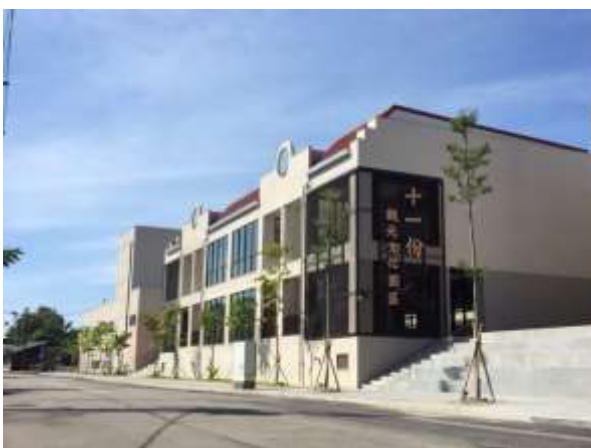
龍潭十一份佳安市場成果照

石門水庫溪洲旅遊服務區業於(108)年 12 月 2 日上網公開閱覽，本府就潛在廠商意見，辦理園區專用路權申請及導入自動駕駛電動巴士之籌備，本案刻正辦理調整招標文件事宜，預計於第 2 季上網公開招標。