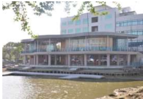
龍潭大池水岸景觀改造成果照