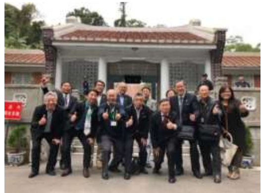
日本東京都旅行業協會暨旬刊旅行新聞推介交流