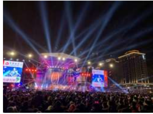
跨年晚會現場人潮