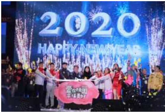
跨年晚會登台倒數