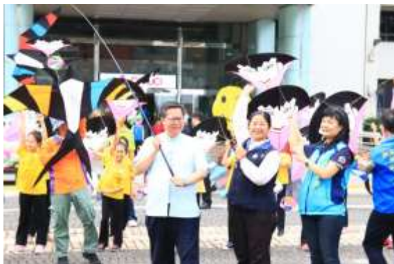
市長、貴賓及小朋友於記者會共同放飛燕子風箏

(2)活動以「童話故事」為主題，由來自瑞士布里(Marcel Burri)風箏大師帶來 13 公尺長的阿拉丁神燈主題風箏，與桃園吉祥物丫桃、園哥，來自瑞士的瑞士牛、小熊風箏、瑞典童話-彼得森農夫、新加坡的魚尾獅、韓國的中國娃娃，齊飛空中，此外，更推出全台第一場的空中劇場(史豔文尬藏鏡人)。