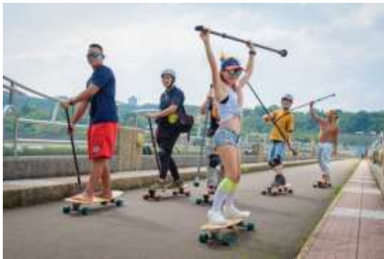
運動遊程-路上衝浪成果照