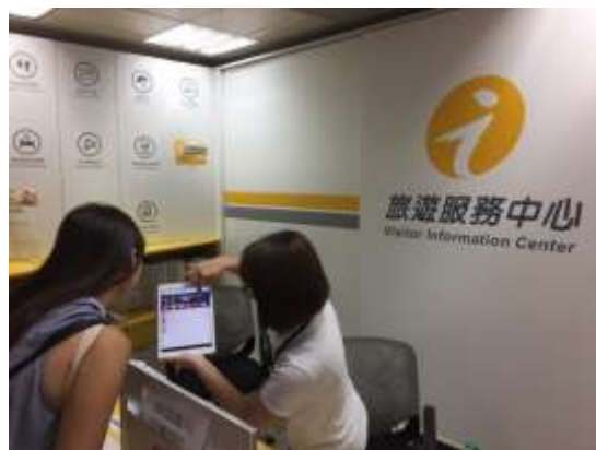
旅服中心遊客諮詢服務