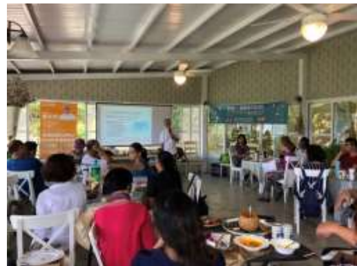
民宿經營者分享及實做