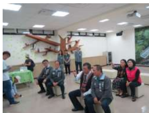
義盛遊客中心內部空間