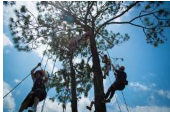
運動遊程-攀樹與護樹成果照