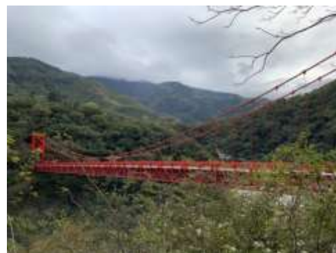
巴陵吊橋結構補牆改善