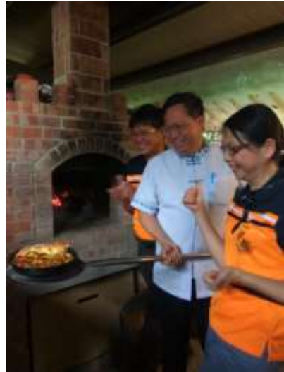
積極協助民宿業多元發展