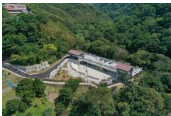
義盛遊客中心俯瞰圖

為創造小烏來風景特定區觀光發展亮點，因應義盛部落居民需求、風景區觀光發展需要及提升遊客服務品質，以多目標使用方式辦理「小烏來風景特定區義盛遊客中心暨里民集會所新建工程」，可作為園區遊客服務據點、義盛里里民集會場所、戶外廣場及停車場等多功能用途。本工程已於 108 年 7 月 12 日工程完工，並於 108 年 11 月 11 日辦理市長剪綵啟用，提供遊客及部落居民最優質的服務據點。