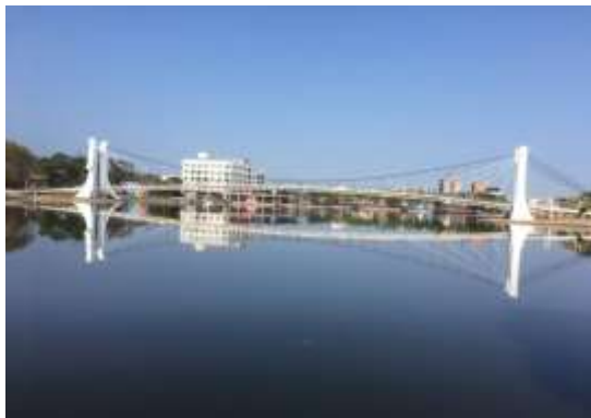
龍潭大池吊橋成果照

為提升龍潭大池周邊公共廁所服務設施，辦理北岸(龍元路側)、西岸(兒童遊戲區旁)及老人會館等三處公共廁所設施更新改善工作，以營造具通風採光乾淨及特色為改善目標。工程案於108年10月開工，目前已完成北岸及老人會館區域工作，西岸公廁因環保局礫間淨化工程自108年12月進行埋管作業截斷施工動線而暫緩施作，該障礙於109年2月11日排除，全案預計於4月底前完成。