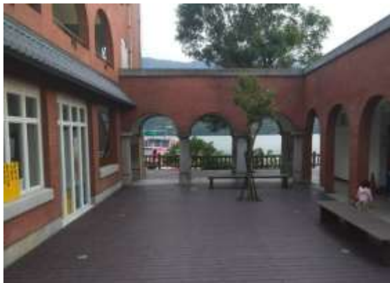
運動休憩點-阿姆坪紅樓完工成果照

1. 本府獲交通部觀光局核定補助「石門水庫及大漢溪流域跨域亮點計畫」6 大工程案件皆於 108 年結算完成，包含「溪洲觀光服務中心與低碳轉運站建置」、「大漢溪左岸自行車道環境」、「運動休憩服務站」、「十一份觀光文化園區整建」、「南苑生態公園夜間環境」及「薑母島登島環境」。此外，觀旅局持續透過平臺會議機制，與「經濟部水利署北區水資源」商討石門水庫觀光合作工作。