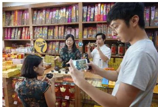
明義堂香行-借問站