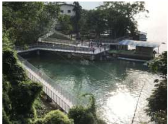
薑母島環湖棧道成果照