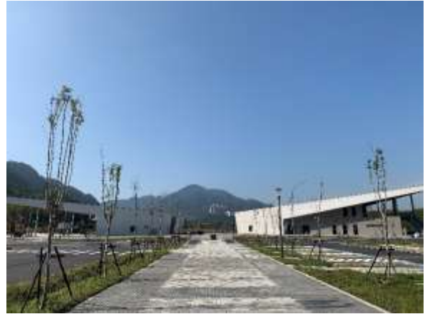
溪洲觀光服務園區建置成果照

3. 本府與北水局合作以龍潭十一份佳安市場及部分宿舍群打造十一份觀光文化園區，全案工程已於 108 年 8 月 2 日竣工，8 月 31 日辦理竣工典禮暨文創園遊會，同步辦理（促參 OT）營運招商作業，第 3 次招商公告於 108 年 12 月 23 日截止，無申請人，在積極蒐集潛在廠商意見後，於 109 年 2 月 10 日召開工作會議研議，將再次評估範圍及權利金等條件後，預計於 3 月底接續辦理後續招商事宜。