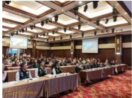
桃園市旅館業從業人員毒品防制宣導會