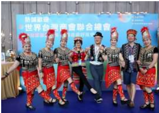
世界台灣商會聯合總會第25屆年會-產業交流

會暨旬刊旅行新聞至本市走訪農博、大溪老街、觀光工廠、寺廟、農場等景點並進行推介交流，爭取更多海外遊客來桃。