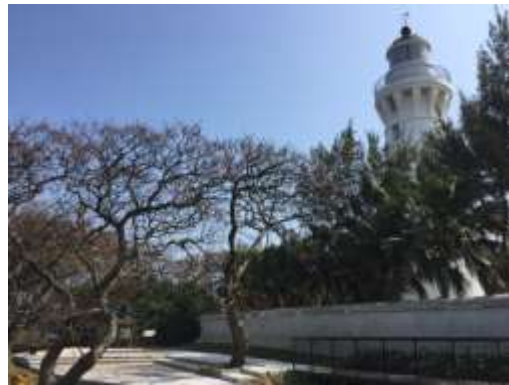
白沙岬燈塔完工成果照