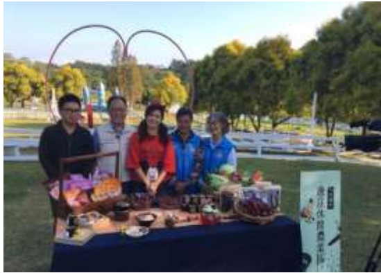
淑麗氣象趴趴 GO-連線直播氣象節目