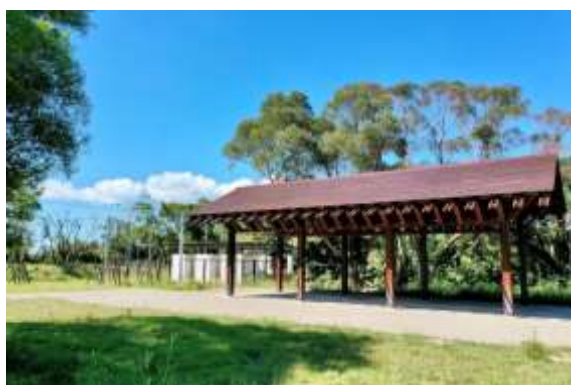
淺山步道涼亭供民眾休憩

本計畫配合桃林鐵路路廊活化及結合綠色運輸功能，推動多路徑親山步道系統觀念，經由桃林鐵路活化廊道的串聯，以騎乘自行車或步行的方式，由東、南、西各方向進入都市之肺「虎頭山風景特定區」，建置桃林鐵路沿線居民親近山林的步道系統，經由桃 11 線稜線步道與虎頭山公園後山步道系統、環保公園等景觀據點結合，讓遊客觀賞「稜線景觀大道」及其沿線景點之美。本工程於 108 年 2 月 1 日開工，三元步道、水汙頭步道及森綠花園區已於 108 年 10 月完工。