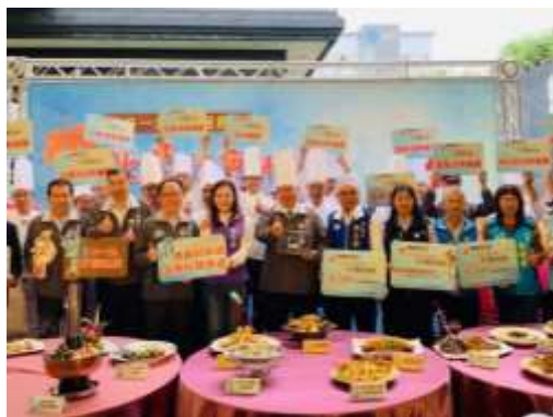
石門活魚美食上菜秀

(3)本次活動於 2019 年 10 月 31 日舉辦宣傳記者會，12 家活魚業者熱情參與活魚料理上菜活動，同時結合周邊遊艇、活魚、觀光遊樂業等 28 個店家推出優惠，再創石門旅遊熱潮，藉由電視節目(來去 check in)、網紅共同行銷，吸引超過 62 則電子及平面媒體報導。