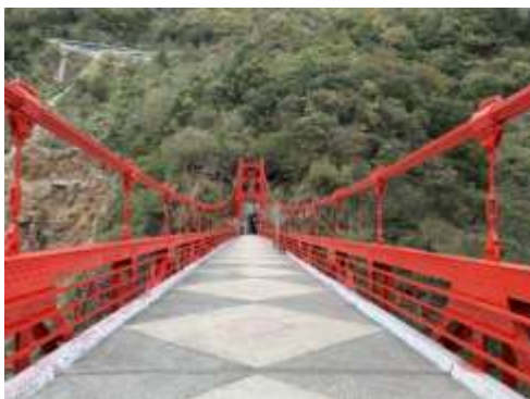
巴陵吊橋新漆外觀

拉拉山風景特定區為北橫 1 日或 2 日旅遊首選，逐步發展上、中、下巴陵步道系統，建構拉拉山地區完整旅遊地圖，提供優質服務。另巴陵吊橋於民國 55 年完成至今已使用 53 年，吊橋構架外觀呈現生鏽掉漆情形，故辦理「拉拉山風景特定區巴陵吊橋結構補強及安全預警工程」進行結構補強改善與建置安全預警系統，以維遊客使用安全，已於 108 年 9 月底完工。