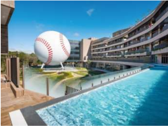
積極協助旅館業快速申設