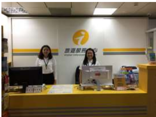
桃園旅遊服務中心

技大學、南亞技術學院、萬能科技大學經營管理，提供旅遊諮詢服務、文宣索取、公車轉乘、住宿資訊及手語視訊等貼心服務。108 年總服務人數為 168,779 人次。