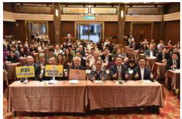
台灣入境旅遊協會-提升桃園觀光產業入境旅遊接待能量論壇